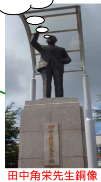
田中角栄先生銅像

ベースボール・マガジン社及び 恒文社の創設者である池田恒雄の コレクション約3500点を 中心に展示しています。