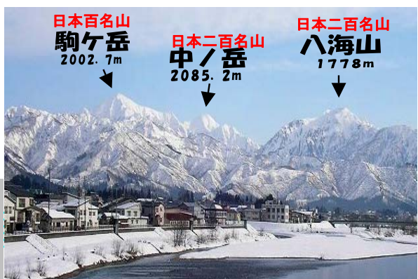
小出橋からの眺望